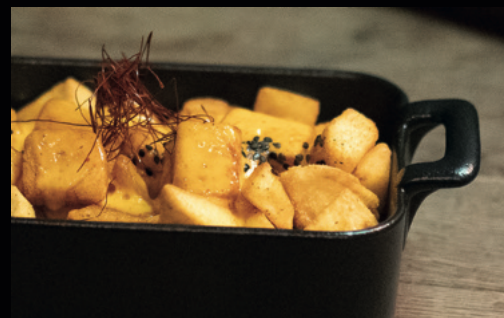
CHEESE & BACON