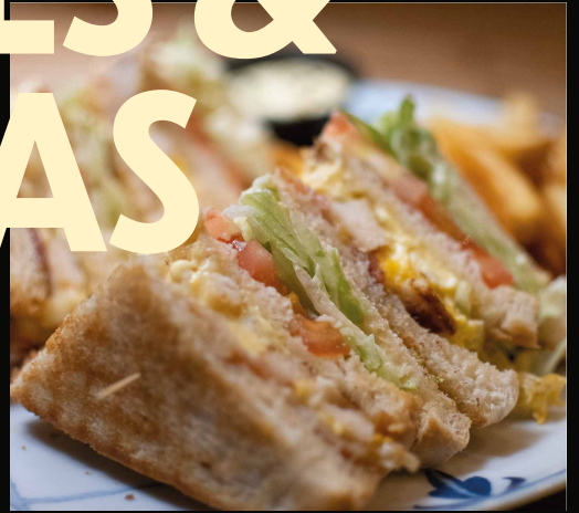
QUESADILLA DE POLLO

*Todas las Quesadillas vienen acompañadas de relish de tomate y nata agria